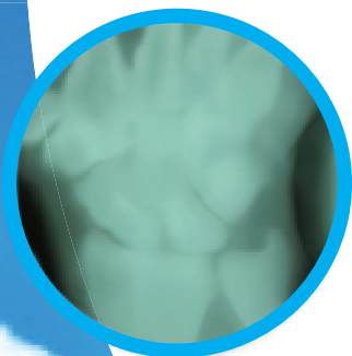
自社グラスファイバー製品